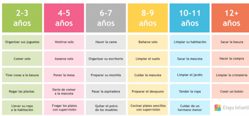
Tabla de actividades domésticas por edades

Cada tarea del hogar requiere una serie de habilidades que los niños solo desarrollarán a medida que crecen. Cuando son muy pequeños es probable que estén listos para recoger sus juguetes pero que no sean capaces de vestirse porque aún no han desarrollado del todo la coordinación. Por tanto, si le pides que te ayude con una tarea para la que aún no está preparado es probable que termine frustrándose y perdiendo la confianza en sí mismo. Para evitar que esto ocurra es importante que las tareas se ajusten a su edad.